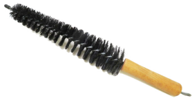
ワイヤーホイールブラシ

本体価格(税抜) ¥7,000 適合: ジャガーXK、MK2、Eタイプ、 ダイムラーV8等 JAGUAR2本爪スピナー用の脱着用ア ダプター。木製でスピナーを痛めませ ん。