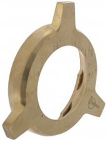
スピナーアダプター、真鍮製、 XK、MK2、ダイムラーV8、

本体価格(税抜) ¥9,000 適合: ジャガーXK、MK2、Eタイプ、 ダイムラーV8等 ジャガー、ダイムラー用のスピナー アダプター。