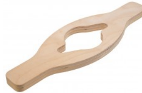
センターロック (2本爪) 脱着工具、 JAGUAR用

本体価格(税抜) ¥9,000 適合: ジャガーXK、MK2、Eタイプ、 ダイムラーV8等 ジャガー、ダイムラー用のスピナー アダプター。