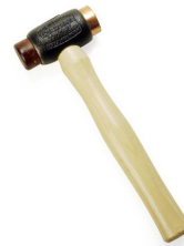
スピナーハンマー、コッパー&レザー

本体価格(税抜) ¥6,300 ワイヤーホイールの清掃用に作られた ブラシです。ホイールの奥の汚れまで しっかり落とします。